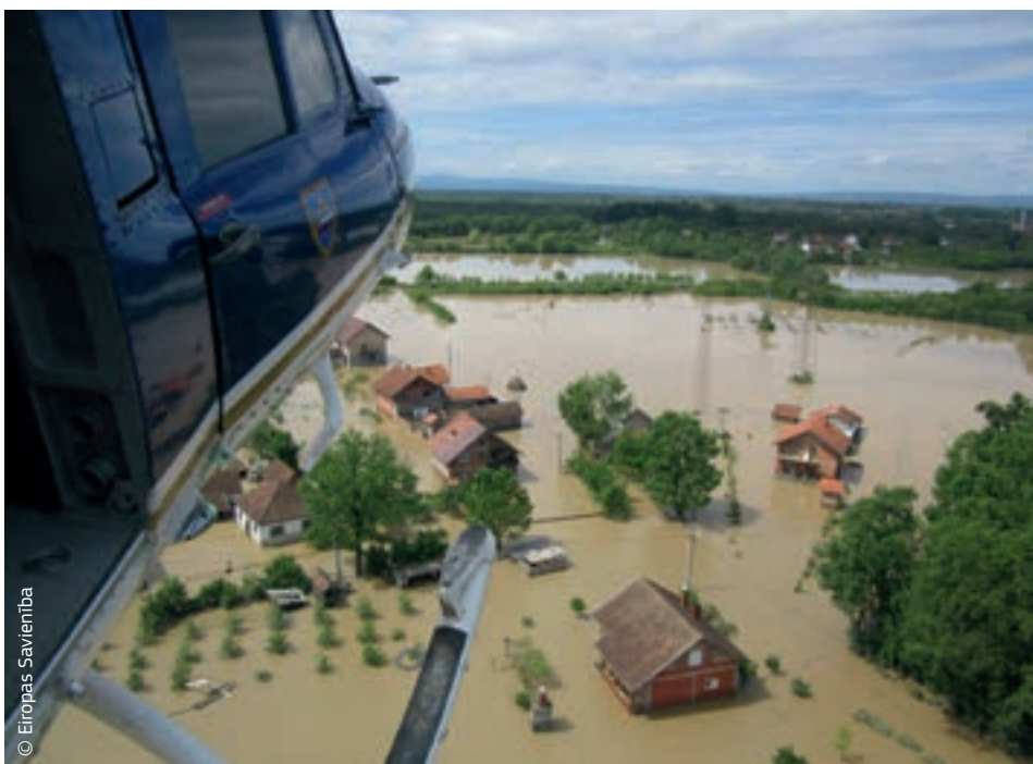
Piedaloties ES Civilās aizsardzības mehānismā, Slovēnijas helikopters sniedz ārkārtas palīdzību plūdos cietušajiem Bosnijā un Hercegovinā.

Papildus palīdzībai, ko ES dalībvalstis nodrošināja, iedarbinot ES civilās aizsardzības mehānismu, ES arī piešķīra trīs miljonus eiro humānajai palīdzībai, lai atbalstītu abu valstu visneaizsargātākos iedzīvotājus. Šo humāno palīdzību saņēma pusmiljons cilvēku. Taču abām valstīm priekšā vēl stāvēja plaši atjaunošanas un rekonstrukcijas darbi.