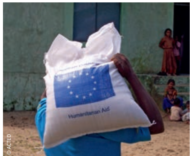
ES finansē humāno palīdzību Indijā kopš 1996. gada.

ES civilās aizsardzības mehānisms palīdz dalībvalstīm novērst katastrofas, sagatavoties ārkārtas situācijām un apvienot resursus, kurus tad var ātri un koordinēti nosūtīt uz katastrofas skartajām valstīm. ES humāno palīdzību piešķir ārpussavienības valstīm, bet šo mehānismu var aktivizēt ārkārtas situācijās, kas izcēlušās gan ES robežās, gan ārpus tām. ES civilās aizsardzības mehānisms ir instruments, kas