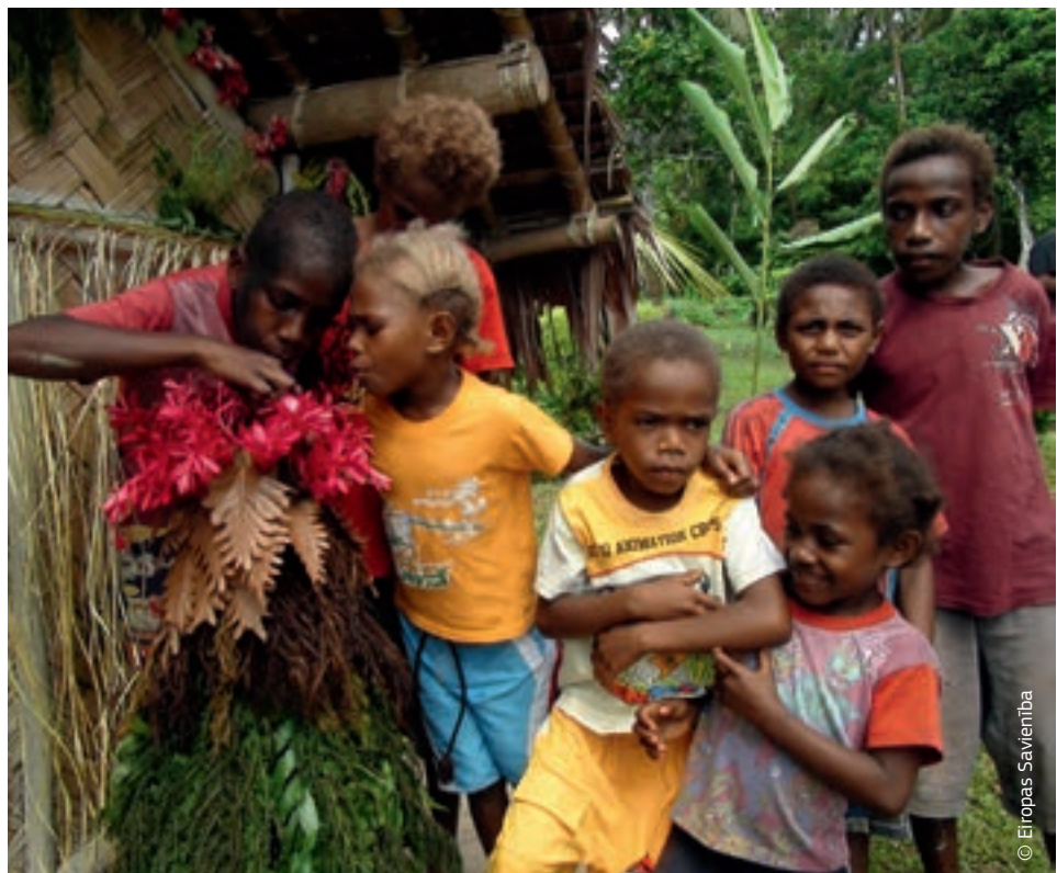
Vanuatu bērni veido Garata kalna vulkāna modeli — šis vulkāns visvairāk apdraud viņu dzīvību.

Eiropas Komisijas pieeja, kurā galvenais uzsvars likts uz izturētspēju, izglābs vairāk dzīvību, ļaus ietaupīt līdzekļus un palīdzēs izskaust nabadzību, šādi vairojot atbalsta pozitīvo ietekmi un sekmējot ilgtspējīgu attīstību.