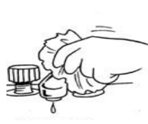
Ar salveti aizgriez krānu