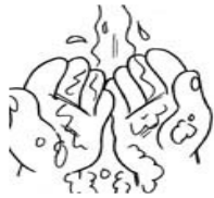
Noskalo 10 sek.