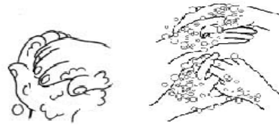
Saziepē un berzē 20 sek.