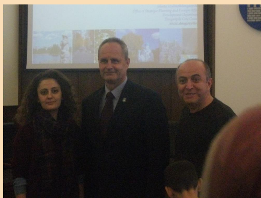
Portugāles un Turcijas delegācijas Daugavpils pilsētas domē