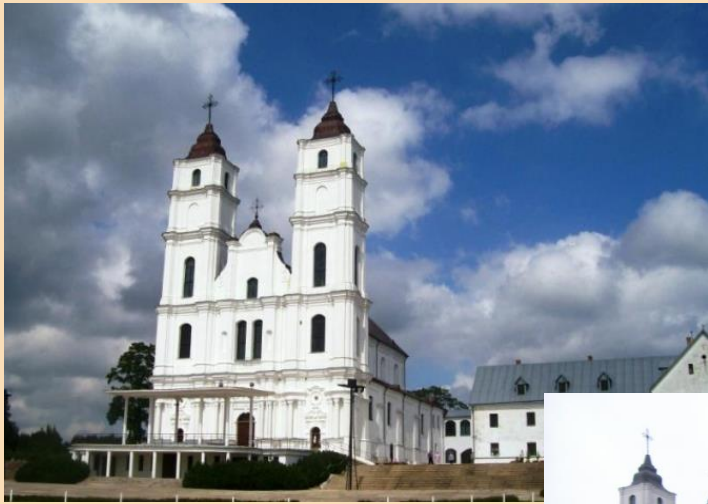
Aglonas Bazilika un...