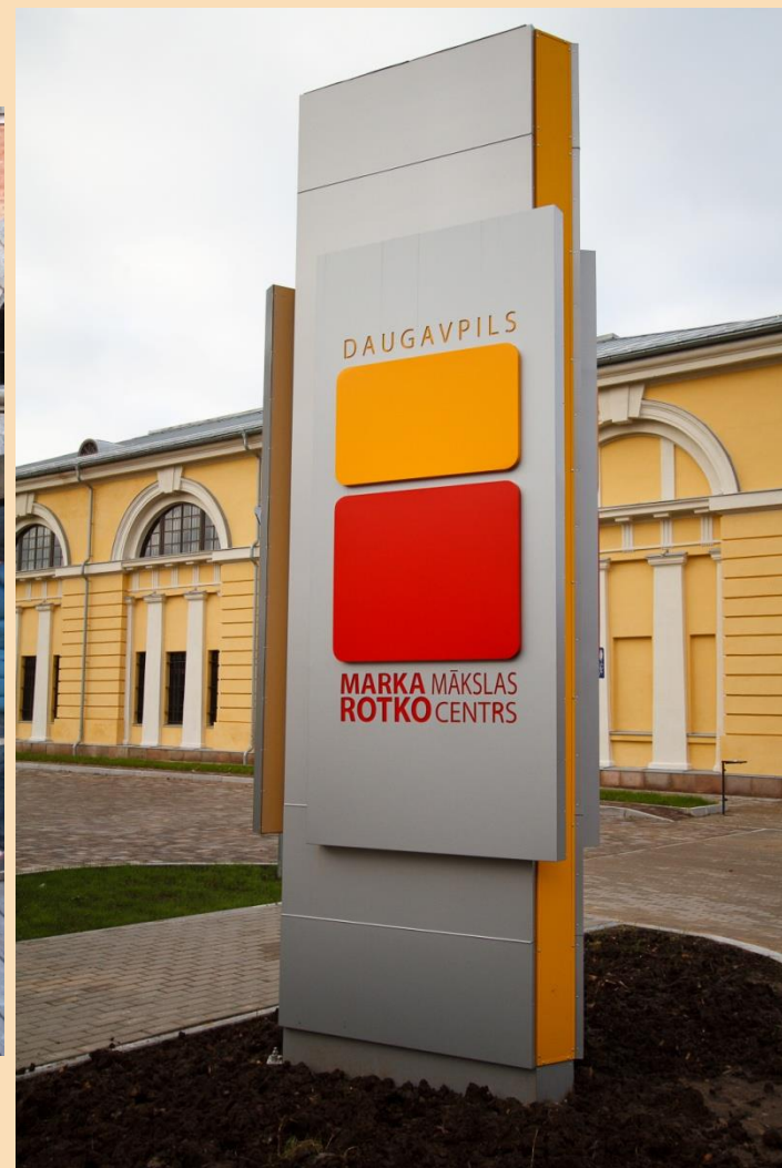
Daugavpils Cietoksnis un Daugavpils Marka Rotko mākslas centrs