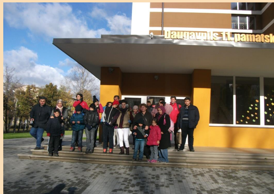
Daugavpils 11.pamatskola uzņem viesus no Portugāles un Turcijas