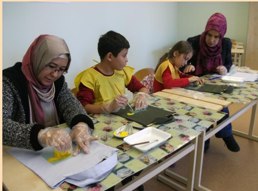
Radošās darbnīcas – auduma somiņu apgleznošana ar zirga attēlu