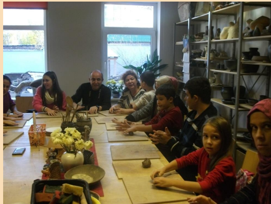
Ekskursijas Daugavpils Māla mākslas centrā un Daugavpils skrošu rūpnīcā