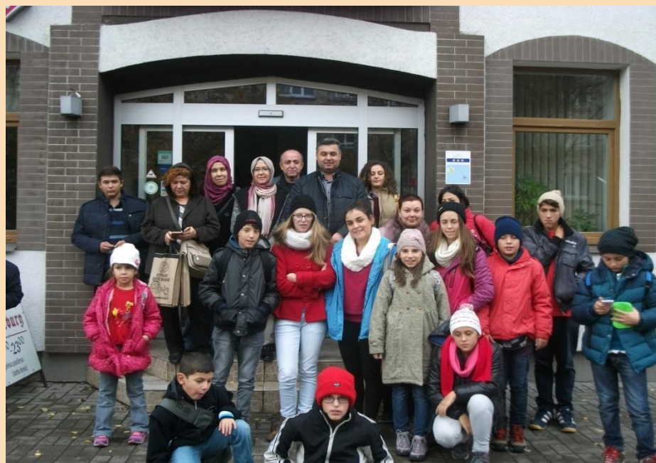
Mūsu ciemiņi pie viesnīcas “Good Stay Dinaburg”