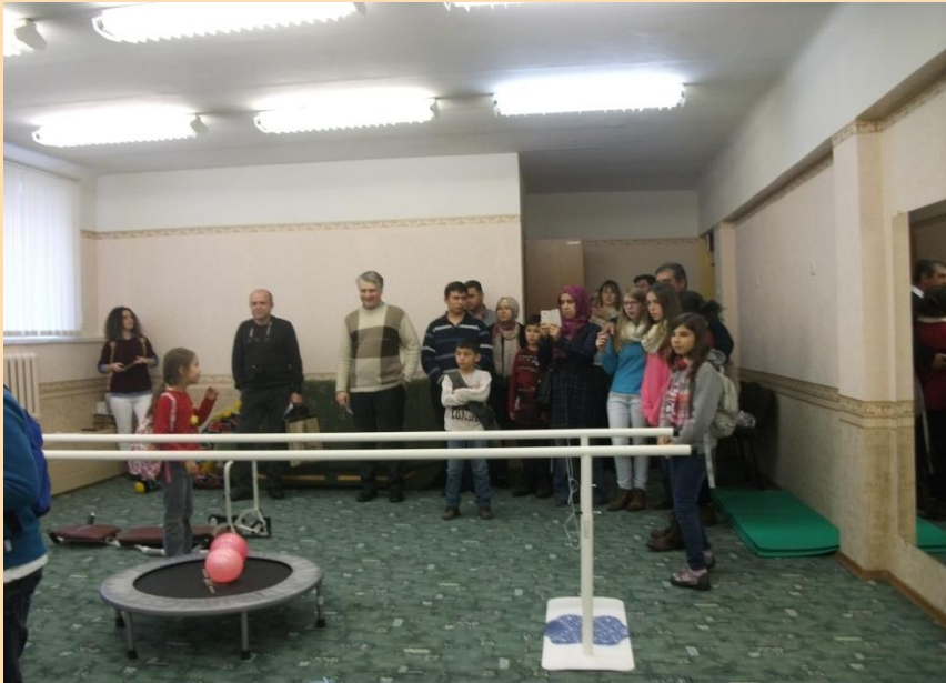
Ekskursija skolas telpās