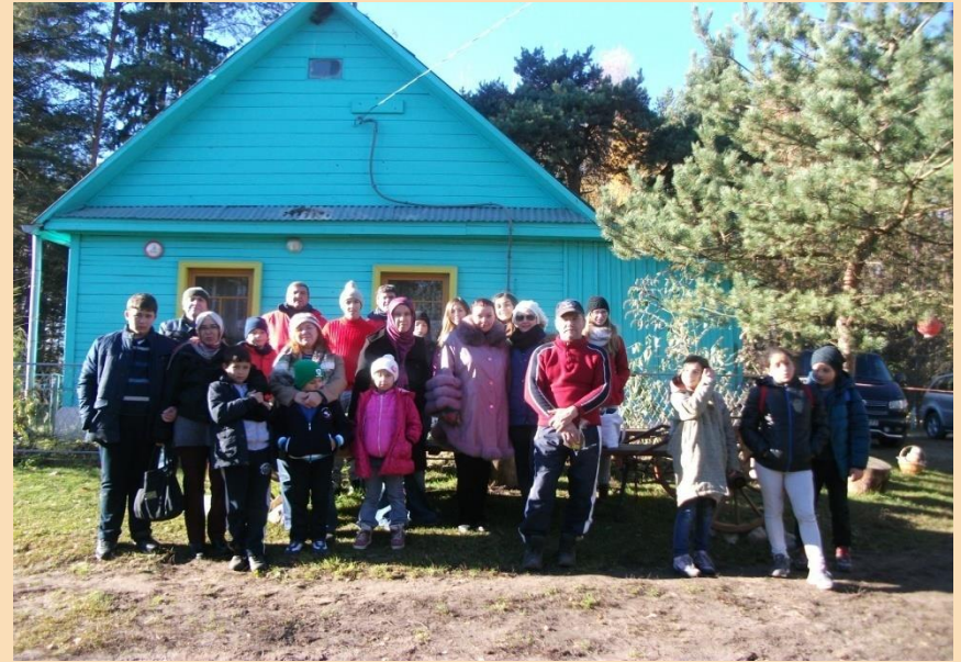
Hipoterapija Naujenes dabas parkā un Kaplavas pagasta “Klajumos”